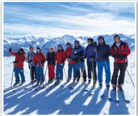
Göttinger Skifahrer vor den hohen Tauern mit dem Großvenediger im Hintergrund

So war der Bus schon fast ausgebucht, bevor der Termin und das Ziel für die diesjährige Ausfahrt feststand.