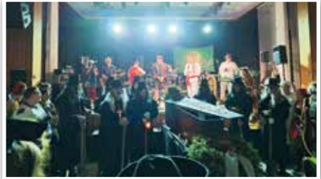
Ein Höhepunkt des Abend die „Waither Totengräber“ beim Abgesang auf die Crunchy Nuts.

Nach einer kurzen Pause hieß es erneut Türen auf zur großen Abschiedsfeier für die Hochzeit- und Festband „The Crunchy Nuts“. Die sich nach 30 Jahren und unzähligen Bühnen und Hochzeitsauftritten von Ihren vielen Fans verabschieden wollten. So war schon nach kurzer Zeit die Halle bis auf den letzten Platz gefüllt. Die Crunchy Nut's holten nochmals alles was sich so in 30 Jahren Bühne aufgebaut hat aus sich heraus und sorgten für eine super Stimmung. So war Tanzfläche vom Anfang bis zum Schluss immer voll besetzt. Ein weiterer Höhepunkt des Abends war die Faschingsgilde aus Bichl bei Bad Tölz, die es sich nicht nehmen ließen mit Ihrem Prinzenpaar und Ihrer Garde, den Crunchy Nuts danke für 20 Jahre Hausball in Bichl zu sagen. Ein weiteres Highlight des Abends war der überraschende Auftritt der Waither Totengräber mit Trauermarsch und Sarg.