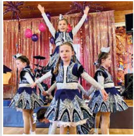
Die Kids Faschingsgarde „Mangfall-Funken“ wurden mit ihrem Gardemarsch zu den Publikumsliebblingen

neue Interpretation des Märchens „Froschkönig“ der Gebrüder Grimm.